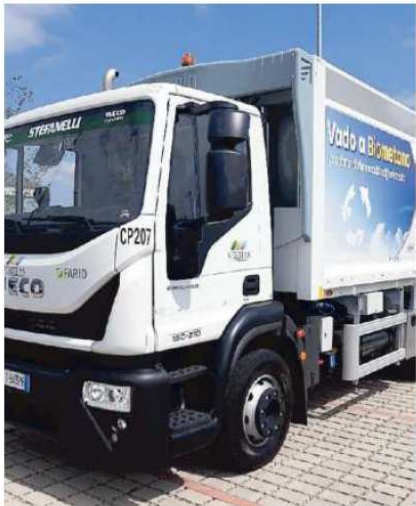
Un camion dei rifiuti di Veritas

Dal primo gennaio del 2024, se non vi saranno intoppi nel percorso, sarà quindi direttamente Veritas a occuparsi della raccolta dei rifiuti nei comuni di Annone Veneto, Caorle, Cinto Caomaggiore, Concordia, Fossalta di Portogruaro, Gruaro, Portogruaro, Pramaggiore, San Michele al Tagliamento, San Stino di Livenza e Teglio Veneto. Un bacino di 95 mila residenti, cui bisogna ag-