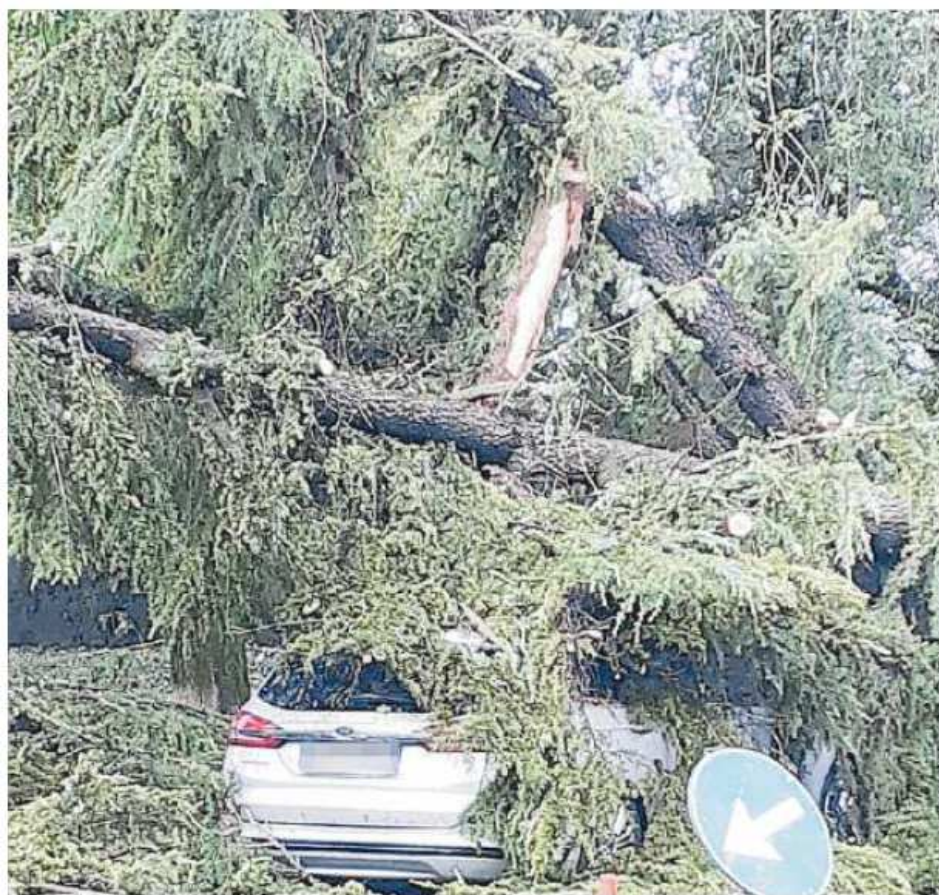
Un'auto travolta da un albero abbattuto dalla furia del vento

Corsa allo sportello del Comune di Dolo per ottenere il rimborso dei danni causati dalle grandinate in Riviera del 19 luglio scorso e dei giorni seguenti