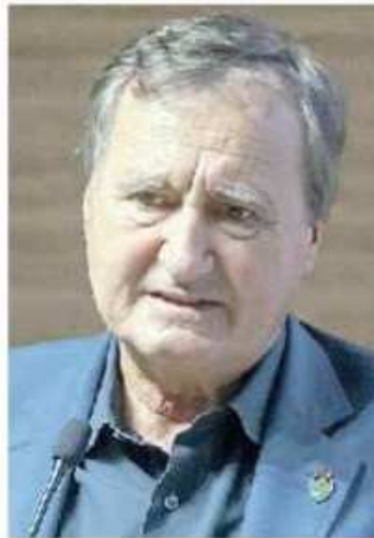
VENEZIA Il sindaco Luigi Brugnaro

E poi c'è la questione dei tempi. La giunta veneta di Luca Zaia ha approvato il bilancio 2024 a Ferragosto e ora la manovra sta per approdare in consiglio regionale. Con numeri, però, sbagliati: se saranno confermati i tagli, il Veneto dovrà rinunciare tra i 15 e i 20 milioni. Dicono che a Palazzo Balbi - dove tra l'altro ieri è stata approvata la Nota di aggiornamento al Defr - nessuno si aspettava una manovra del genere e che la questione sarà sottoposta alla Conferenza delle Regioni. Il paradosso, poi, è che i bilanci degli enti locali devono essere approvati entro il 31 dicembre e lo stesso dicasi della legge di bilancio statale che deve mettere i paletti per Comuni e Regioni. Si rischia un fare e disfare.